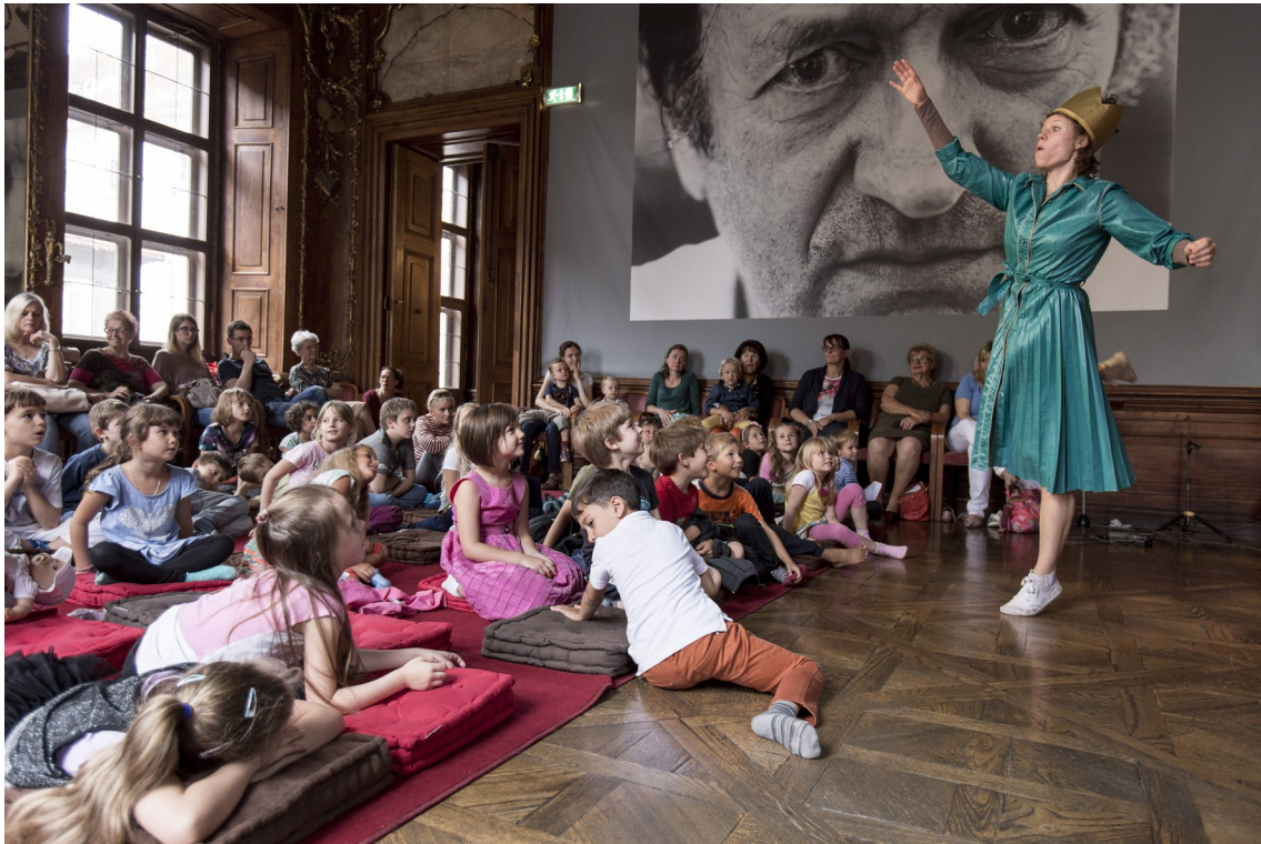
Der König und der Himmel