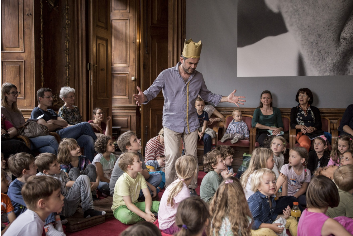
Der König schreitet durch das Schloss und trifft ...