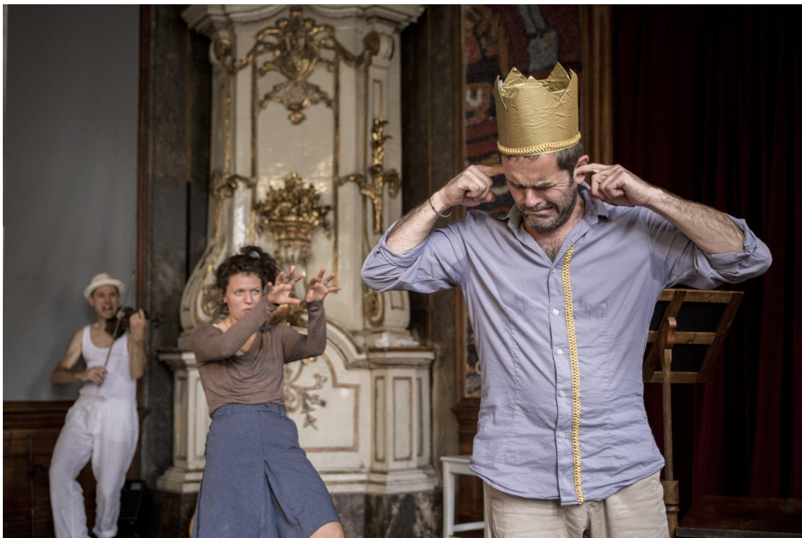
... auf einen Geist !