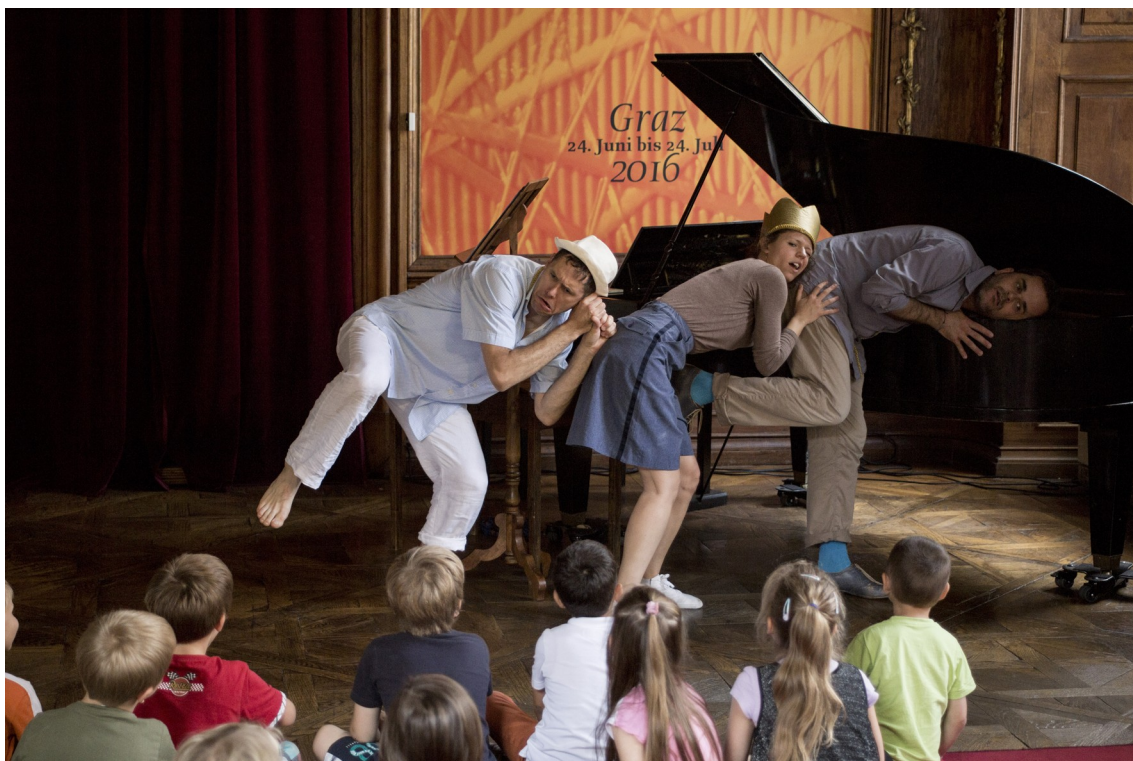
Auf der Suche nach dem Meer...